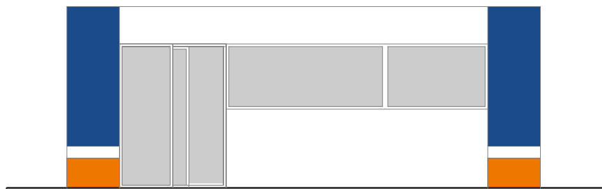
ansicht von vorn